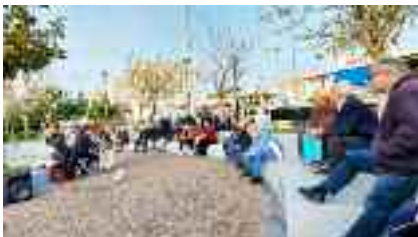
6-4, ΠΕΡΙΣΤΕΡΙ Επιτροπή για την ενίσχυση του λαϊκού εισοδήματος

ματος και κατά της εμπλοκής στον ιμπεριαλιστικό πόλεμο. Από τις παρεμβάσεις που έγιναν, αναδείχθηκαν οι δυσκολίες που αντιμετωπίζουν τα εργατικά - λαϊκά στρώματα από τη λαίλαπα της ακρίβειας,