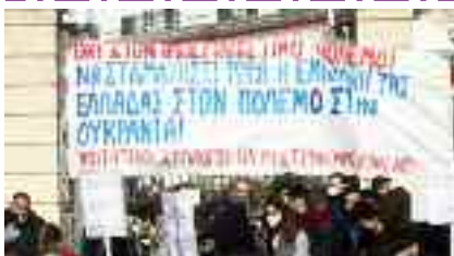
2-3, Φοιτητικοί Σύλλογοι Θεσσαλονίκης «Ακύρωση ελληνοαμερικανικής συμφωνίας για τις βάσεις»