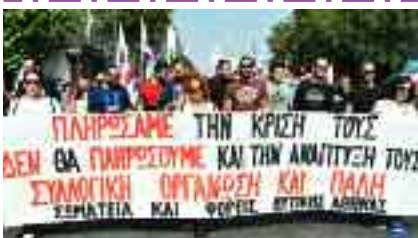
12-4, ΣΩΜΑΤΕΙΑ - ΦΟΡΕΙΣ Δ.ΑΘΗΝΑΣ Δράσεις να δυναμώσει ο αγώνας κατά της ακρίβειας