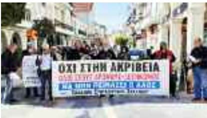
14-4, ΖΑΚΥΝΘΟΣ Συνταξιούχοι για την ακρίβεια και για αυξήσεις στις συντάξεις