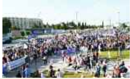
~~~~~ Οι Μαραθωνοδρόμοι στο Υπ. Άμυνας ~~~~~