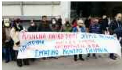
18-4, ΚΑΜΙΝΙΑ Στη ΔΕΗ ενάντια στις αυξήσεις και τις διακοπές ρεύματος