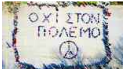
5-3, 27ο Δημοτικό Σχολείο Λάρισας Σχημάτισαν το μήνυμα με τις τσάντες τους