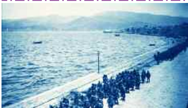
1) Έλληνες στρατιώτες παρελαύνουν στην προκυμαία της Σμύρνης

Η Μικρασιατική Εκστρατεία και Καταστροφή δεν είχε καμιά σχέση με το δικαίωμα της αυτοδιάθεσης των λαών. Ήταν το αποτέλεσμα της συμμετοχής της άρχουσας τάξης της Ελλάδας προκειμένου να προωθησει στην πράξη τη στρατηγική της «Μεγάλης Ιδέας», τα συμφέροντα των Ελλήνων κεφαλαιοκρατών, τα οποία διαπλέκονταν μ' αυτά των τότε ιμπεριαλιστικών δυνάμεων, ιδιαίτερα της Αγγλίας.