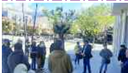
19-4, ΑΡΓΟΣΤΟΛΙ Διαμαρτυρία για τα αυξημένα τέλη νερού και καθαριότητας