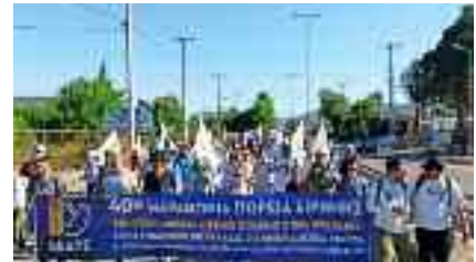
~~~~~ Στον Τύμβο Μαραθώνος ~~~~~