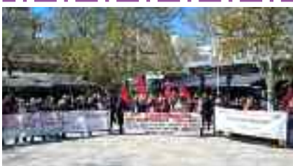
11-4, ΣΥΝΤΑΞΙΟΥΧΟΙ ΣΤΕΡΕΑΣ-ΕΥΒΟΙΑΣ Αυξήσεις στις συντάξεις, απεμπλοκή απ' τον Πόλεμο