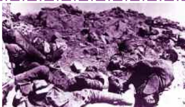
4) Νεκροί Έλληνες στρατιώτες στην μάχη του Αφίων Καραχισάρ