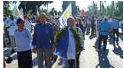
~~~~~ Στο Μνημείο Γρ. Λαμπράκη ~~~~~