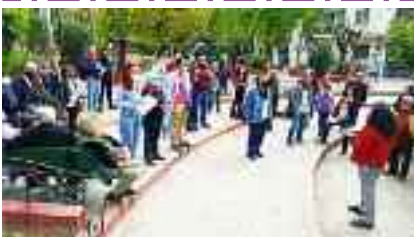
16-4, ΚΥΨΕΛΗ - ΦΩΚΙΩΝΟΣ ΝΕΓΡΗ «Δεν περιμένουμε λύση από "σωτήρες"»