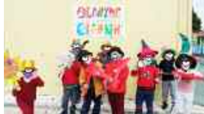
3-3, 4ο Νηπιαγωγείο Αγίου Στεφάνου Δράσεις ενάντια στον πόλεμο και υπέρ της ειρήνης