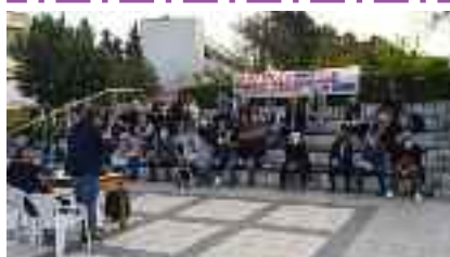
18-4, ΣΩΜΑΤΕΙΑ- ΦΟΡΕΙΣ ΘΕΣΣΑΛΟΝΙΚΗΣ Επιτροπή ενάντια στην ακρίβεια και δράσεις για το επόμενο διάστημα