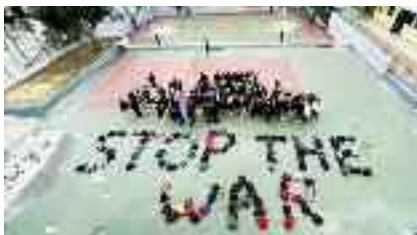
2-3, 2ο ΓΕΛ Μεταμόρφωσης Το μήνυμα των μαθητών με τις σχολικές τσάντες τους