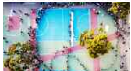
7-4, 1ο Δημοτικό Σχολείο Χολαργού Τα παιδιά ενώθηκαν στο σήμα της Ειρήνης