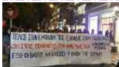
4-3, Φοιτητικοί Σύλλογοι Κρήτης «Όχι στους πολέμους των ιμπεριαλιστών...»