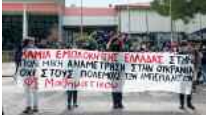
2-3, Φοιτητικοί Σύλλογοι Πανεπιστημίου Πατρών «Δώστε λεφτά για την Παιδεία»

γονείς στο πλευρό τους, διακρίξαν με πανό και ζωγραφιές «ΟΧΙ στον πόλεμο, ΝΑΙ στην Ειρήνη και τη Φιλία των Λαών», την αλληλεγγύη στους λαούς και τους μαθητές που δεν βρίσκονται στα σχολεία τους.