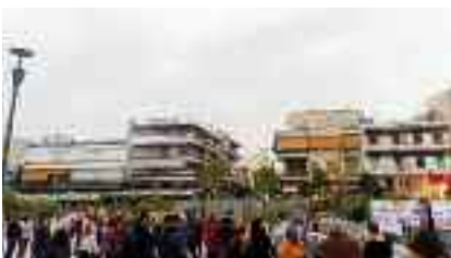
15-4, ΚΟΡΥΔΑΛΛΟΣ Κατά της ακρίβειας και για τη στήριξη του λαϊκού εισοδήματος