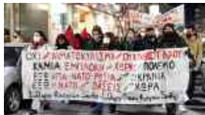
3-3, Φοιτητικοί Σύλλογοι της Ξάνθης «Βάζουν τον ελληνικό λαό στο στόμα του λύκου!»