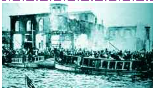
6) Η κατάληξη της Μικρασιατικής Εκστρατείας