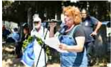
~~~~~ Στην Παλήνη ~~~~~