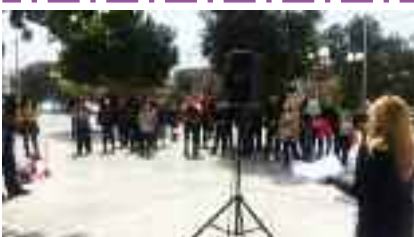
16-4, ΠΕΡΑΜΑ Συγκροτήθηκε Επιτροπή Αγώνα κατά της ακρίβειας