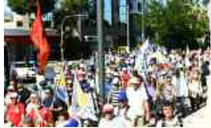
~~~~~ Η Πορεία προς το Υπ. Άμυνας ~~~~~