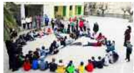
9-3, Μαθ. 103ου Δημοτικού Σχολείου Αθήνας Το σήμα της Ειρήνης