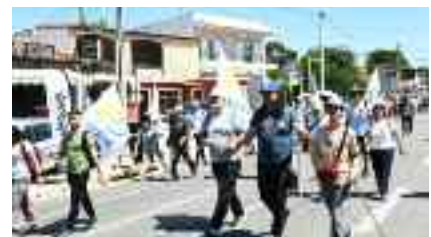
~~~~~ Στη Ραφήνα ~~~~~