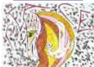
Γεράσιμος Μ.Λυμπεράτος Στίχοι- Ζωγραφιά ( Σύδνεϊ Αυστραλίας )

Και τώρα νέοι δυνάστες ήρθαν πέρα απ' της Ρωσίας τα μέρη που αντί για μπαλαλαίκες κρατούν όπλα φονικά, στο χέρι.