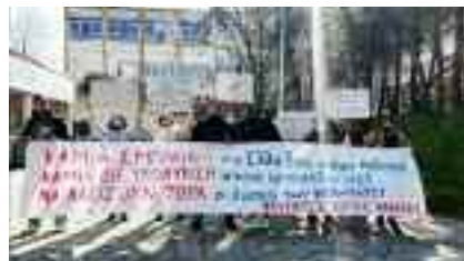
3-3, Φοιτητές ΔΗΠΑΕ Καβάλας «ΗΠΑ - ΝΑΤΟ - ΕΕ - Ρωσία δολοφόνοι των Λαών»