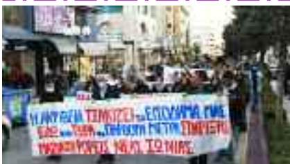
12-4, ΝΕΑ ΙΩΝΙΑ Συγκέντρωση για την Ακρίβεια στην Πλ. Σημηριώτη