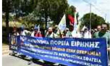
~~~~~ Στο Πικέριμ ~~~~~