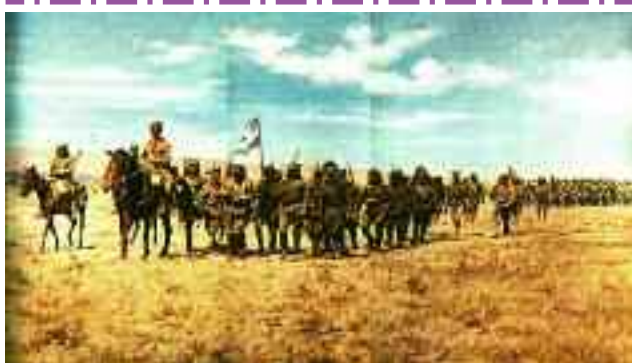
3) Στο Σαγγάριο