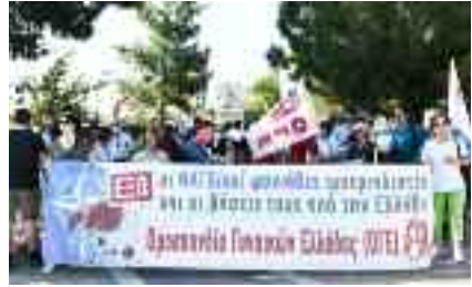
~~~~~ Στην Αγία Παρασκευή ~~~~~