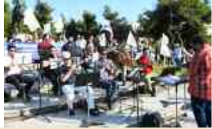
~~~~~ Το μουσικό πρόγραμμα στη συγκέντρωση ~~~~~