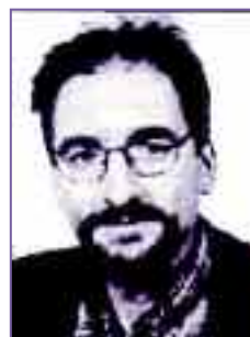
Μικρή καντάτα για τον Προμηθέα

I Λυσούσαν οι βοριάδες του Καυκάσου να σβήσουν την ανάσα της φωτιάς που ολόφωτη καίει μοιρασμένη απλόχερα στων ανθρώπων τις εστίες φυσούσαν να σβήσουν την καυτή της θράκα αλλ' οι πυκνές ριπές σπάσανε τα δεσμά του κι' ανεμπόδιστος στον άγριο κόσμο βαδίζει μ' αλήθειες τους δεμένους εμβριθής ξεσηκώνει μα κάποτε πέταξε απ' τη μάχιμη μνήμη τους τη συλλογική κι' ηρωική μ' ένα φτερωτό πυρόξανθο άλογο αυτοί που τον κυνήγησαν σκορπίσανε