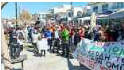
12-4, ΝΕΑ ΣΤΥΡΑ Ενάντια στην εγκατάσταση αιολικών σταθμών σε αρχαιολογικούς χώρους