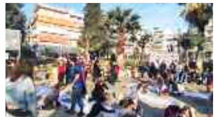
4-4, Ένωση Γονέων πλ. Πλυτά Παγκράτι Σε πανό «έναν κόσμο ειρηνικό»