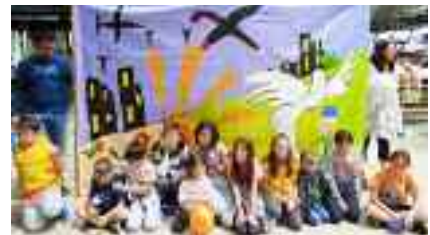
16-4, Σχολεία της Ν.Ιωνίας πλ. Σημηριώτη. Ζωγράφισαν τον κόσμο του ονείρου τους