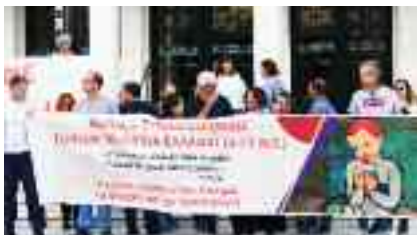
1-3, Α.Σ.Γ.Μ.Ε. - στο Ευγενίδειο «Η Ειρήνη όνειρο κάθε παιδιού. Γι' αυτήν αγωνιζόμαστε»