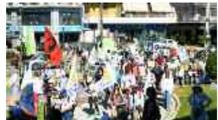
~~~~~ Στη Νέα Μάκρη ~~~~~