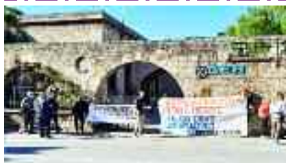
20-4, ΡΟΔΟΣ Στη ΔΕΗ ενάντια στις αυξήσεις στην τιμή του ρεύματος