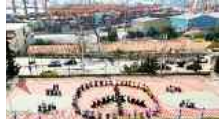
19-3, Μαθ.Δημ.Σχολείου Περάματος Το σήμα της Ειρήνης με φόντο την COSCO