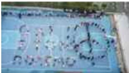
1-3, Λαύριο 2ο Δημοτικό Σχολείο «Όχι άλλοι πόλεμοι! Όχι άλλο αίμα! Φτάνει πα!»