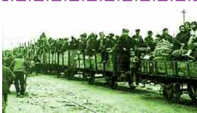
5) Έλληνες της Μ. Ασίας ακολουθούν τον στρατό κατά την υποχώρησή του