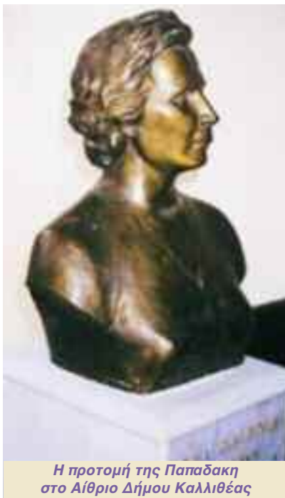
Η προτομή της Παπαδάκη στο Αίθριο Δήμου Καλλιθέας