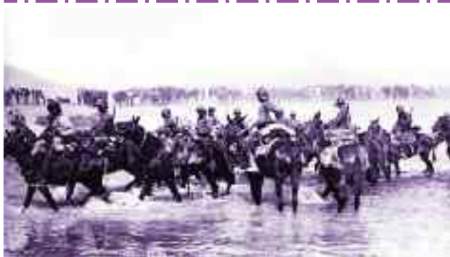
2) Επέλαση του ελληνικού στρατού κατά την Μικρασιατική εκστρατεία