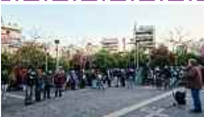
11-4, ΝΙΚΑΙΑ - ΠΕΡΙΒΟΛΑΚΙ Φορείς και Σύλλογοι της πόλης ενάντια στη λαίλαπα της ακρίβειας