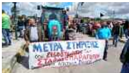
19-4, ΗΛΕΙΑ Αγρότες απαιτώντας μέτρα στήριξης