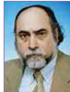
Υπήρξαν άνθρωποι που πάλεψαν

Αφιερωμένο στο μήνυμα των αγώνων, της ζωής και του θανάτου του μεγάλου ρομαντικού διεθνιστή επαναστάτη Ερνέστο Τσε Γκεβέρα