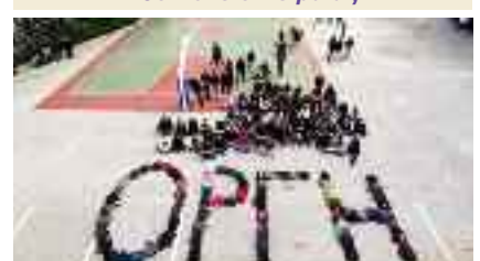
5ο ΓΕΛ Χαλάνδρι