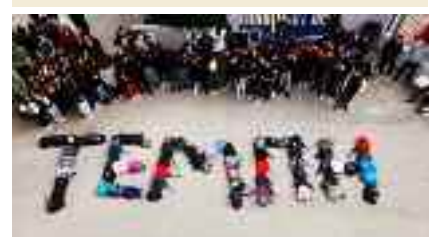
10ο Λύκειο Πειραιάς