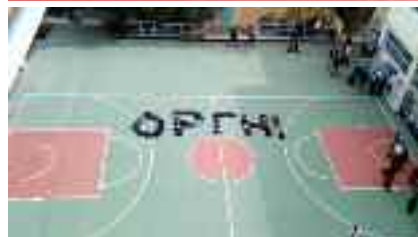
2ο Πειραματικό Αθήνας