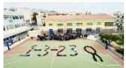
6ο ΓΕΛ Καλλιθέα