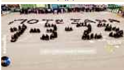
2ο Λύκειο Παλαιό Φάληρο