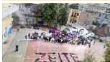
2ο Γυμνάσιο Κερασίνοι