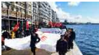
~~~~~ Θεσσαλονίκη ~~~~~