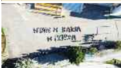
~~~~~ Βόλος ~~~~~