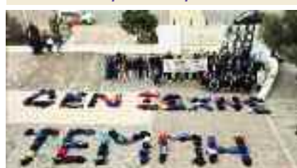
6ο ΓΕΛ Ολυμπικό Χωριό