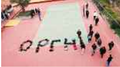
4ο ΓΕΛ Αγ.Παρασκευή

τάληψεις κι άλλες μορφές διαμαρτυρίας. Γραφουν στους τοίχους και σχηματίζουν συνθήματα με τις τσάντες τους, όπως «Οργή», «Το έγκλημα αυτό να μην συγκαλυφθεί - όλων των νεκρών να γίνουμε φωνή» κ.α.