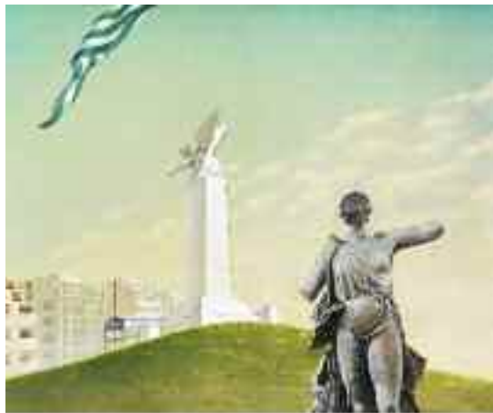
Πέτρος Ζουμπουλάκης «Οι Δύο Νίκες»

Κώστας Ευαγγελάτος Ζωγράφος, Λογοτέχνης Θεωρητικός της τέχνης