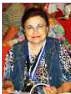
Από «Κυοφορώντας την Ελπίδα»