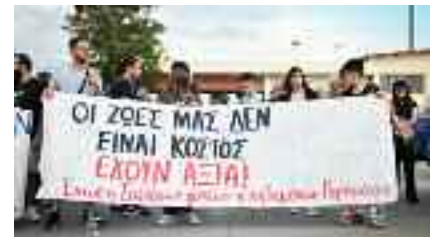
~~~~~ Στην Πλατεία Κοραή του Πειραιά ~~~~~