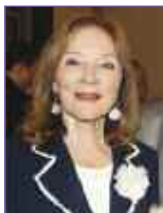
ΣΗΜΕΙΑ ΤΟΝ ΚΑΙΡΩΝ

Ψάχνουν με πάθος ευκαιρίες προβολής και δεν τους μέλει τόσο τί θα πουν αλλά το πώς, με πόση ξιπασιά και φαντασία: Ο Κάπα, νέος ποιητής, σε μιαν οθόνη πρόβαλε το δασωμένο του φαλλό φιλάρεσκα χαμογελώντας κι ο Μί την Εύα του στο άλσος του Αυνάν υπο τους ήχους πατριωτικής έξαρσης. Ω! είπαν οι πολλοί, ανίδεοι πλην όμως γνωμοδοτικοί επί παντός: Τι τέχνη θαυμαστή! Πόση πρωτοτυπία! Ο Τύπος ξόδεψε άφθονο μελάνι για το θέμα κι ανήλθαν κατακόρυφα οι πωλήσεις! Οι Κάπα-Μί χαίρονται την επωνυμία, οι εκδότες το πάχος των εισπράξεων κι οι αναγνώστες, εθισμένοι, αναζητούν το νέο θέμα, για να ντύσουν το κενό.