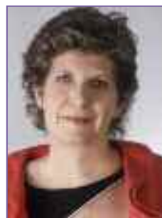
Παραδοθήκαμε στη σταύρωση

Ζυγίσαμε τα λάθη μας, μοιράσαμε κέρδη κι ενοχές. Το μήνυμα όμως χάθηκε. Η νίκη δεν ήταν με το μέρος μας, ίσως δεν την ποθήσαμε οι ίδιοι όσο θα 'πρεπε. Τώρα ολομόναχοι, με τα κεριά σβησμένα, παραδοθήκαμε στη σταύρωση.