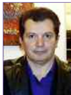
Από «Η Ελεγεία των Εκβατώνων»

Προσμένεις κάτι ατόφιο να τυλίξει την ακατέργαστη μορφή που σε ναρκώνει. Στέκεσαι εκεί που πέρασαν τα τανκ. Ο φόνος συντελέστηκε σε κλάσμα της στιγμής. Ουρανοδρόμος πυρετός μπλόκαρε τα μηνίγγια στρατεύτηκες στο σμήνος των θυμάτων στέρεψες από πάθος και σαγήνη και δε θυμάσαι τίποτα.