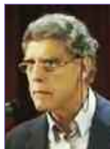
ΘΑ ΣΕ ΓΙΟΡΤΑΣΩ!!!