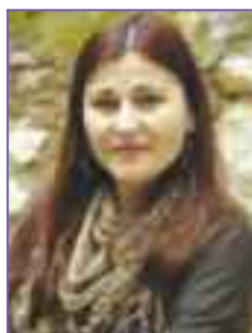
ΠΑΡΑΚΛΗΣΗ ΣΤΟ ΑΠΟΛΛΩΝΙΟ ΦΩΣ

Ήλιε, δίσκε λαμπρέ, τροφοδότη, το φως σπείρε και φώτιζε νου και ψυχή πριν οι μέρες μας λείψουν. Ήλιε, χρυσέ αρματηλάτη, στολίδι ουράνιο, της Γης το συθέμελο άνθισε με της ελιάς τον ασημένιο κλώνο και σφυρηλάτησε με τα χρυσά σφυριά σου τον δίπυλο κόσμο. Ήλιε, ουράνιε ανθέ, εσύ στρατηλάτη φωτεινέ, με τη λαμπρή σου φορεσιά σβήσε τα σύννεφα και προστάτεψε της μάνας Γης το πρόσωπο να καρπίσουν τα χρυσά μήλα των Εσπερίδων. Την Αγάπη, την Ειρήνη, την Ελπίδα ταξίδεψε πάνω από θάλασσες και στεριές πριν ο Φαέθοντας γιος δράξει τα ινία του άρματος Σου και κατακάψει τη χέρσα ζήση μας