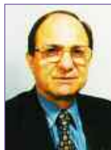
ΤΟ ΝΕΟ ΗΘΟΣ