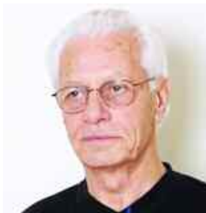
ρο του αρχαίου δράματος.

Από το 1959 σκηνοθέτησε στις εκεί κρατικές σκηνές περισσότερες από ογδόντα παραστάσεις, ενώ διετέλεσε διευθυντής στο Δημοτικό Θέατρο του Μπίλεφελντ. Διασκεύασε και μετέφρασε έργα, κυρίως από τον χώ-